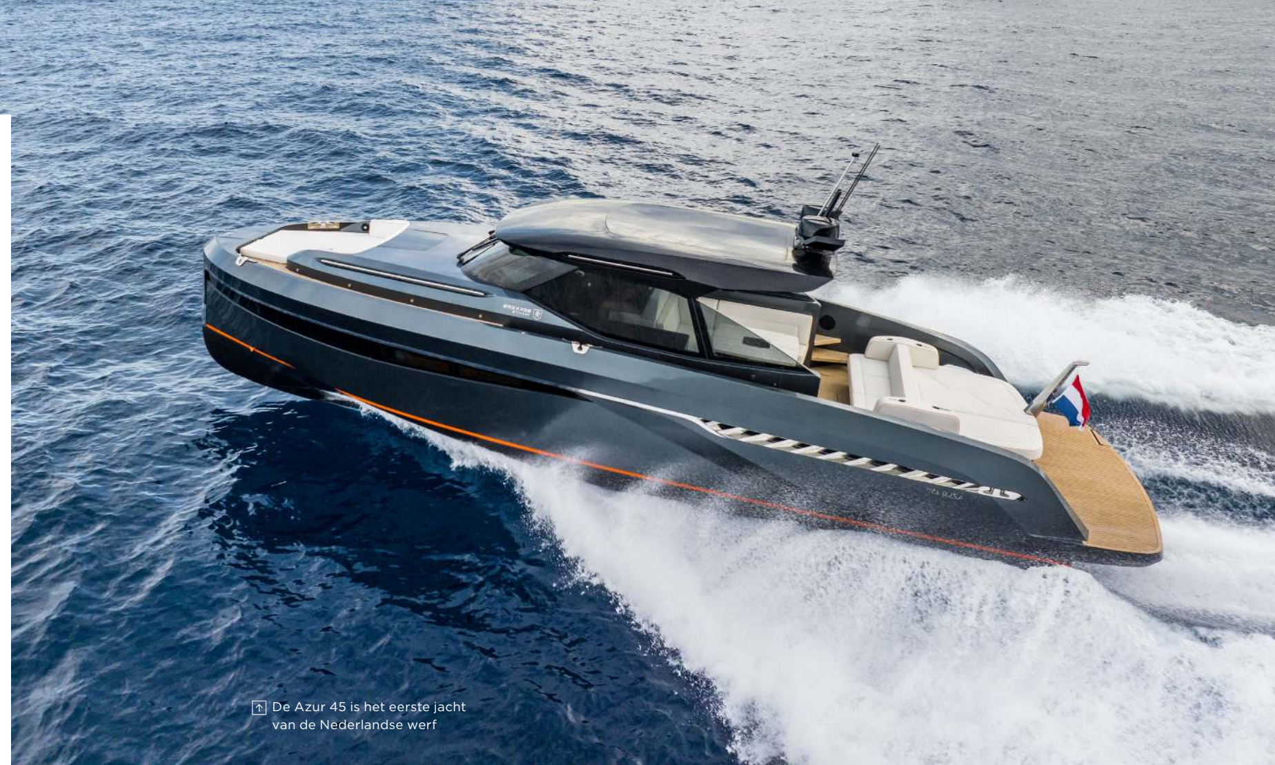
De Azur 45 is het eerste jacht van de Nederlandse werf

In het segment motorjachten tot 50 voet is genoeg te koop maar het ontbrak aan de superjacht-kwaliteit. Zodoende ontstond het plan om een zeer exclusief jacht te gaan ontwerpen met een klasieke, tijdloze maar moderne – en tegelijk elegante – uitstraling. Bekkers wilde out of the box denken om een onderscheidend aluminium schip op de markt te brengen met een hoge mate van comfort en veel bewegingsruimte. Ook werd veel aandacht besteed aan geluids- en trillingsreductie door middel van het toepassen van de beste materialen. Bekkers vertelt: “Aluminium is ongeveer dertig procent lichter dan polyester, en het ontwerp is aan te passen naar de wensen van de toekomstige eigenaars; iets wat met polyesterbouw uit een mal niet mogelijk is.” Het gevolg van dit idee was het vlaggenschip van de werf: de Azur 45. Met haar 13,5 meter lengte was dit mini-superjacht een groot succes. Het vraagt flink wat lef om als nieuwe werf met een gloednieuwe weekender op de proppen te komen. Al helemaal wanneer de insteek is om in het topsegment te starten. Maar Bekkers bewees